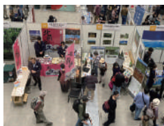
2023年八王子フェスの様子

展示ブースや体験ブースをめぐって全国の日本遺産に出会おう!ブースでは各地の日本遺産にちなんだ名産品などの販売も。