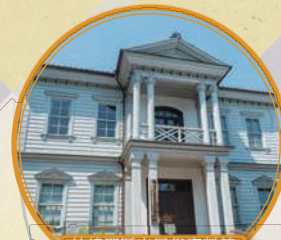
神崎郡歴史民俗資料館

辻川町を治めた大庄屋の屋敷跡。江戸時代中～末期に造られたが、銀の馬車道建設にあたって宿場町の中央を道が通るように、屋敷地の一部を供出した。