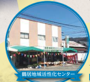
鶴居地域活性化センター