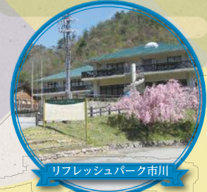
リフレッシュパーク市川