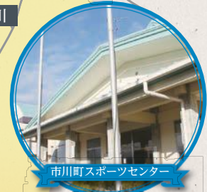
市川町スポーツセンター