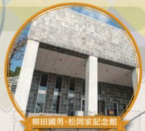
柳田國男・松岡家記念館