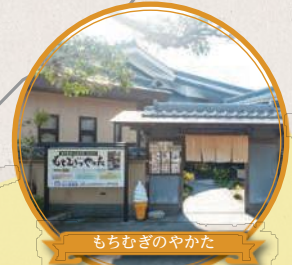
もちむぎのやかた