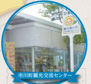
市川町観光交流センター